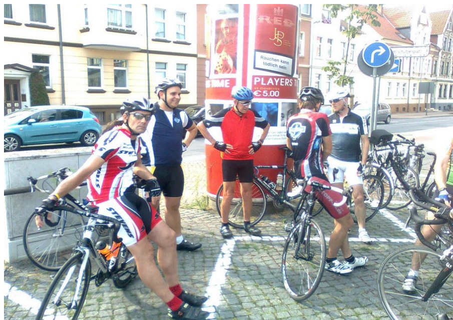
So wie wir es alle kennen: Dienstags am Schützenplatz.

Generell hoffe ich auf eine positive Entwicklung des Eulenexpress. Damit auch in 2012 dienstags (und nicht nur dienstags) viele "hungrige" Radfahrer an der Litfass-Säule stehen werden, um mehr oder minder lange und vor allem schöne, interessante, lustige und mit Sicherheit auch anstrengende Ausfahrten zu teilen. Lasst uns aufbrechen ich kann es kaum noch abwarten!! Ich will auch mehr Eulenexpress Trikots sehen.