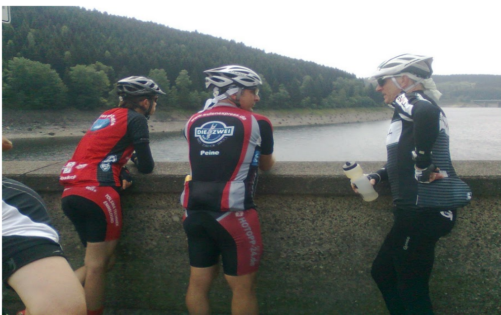
Kurzer Stopp an der Okertalsperre bevor es hoch zum Torfhaus ging.