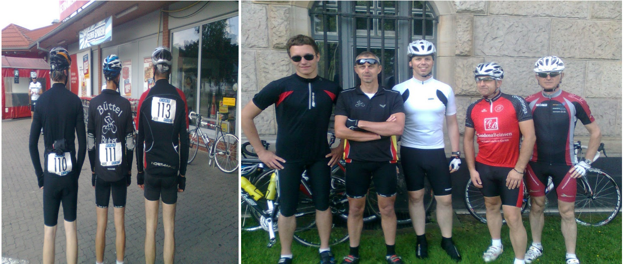
Sarstedt RTF und Hannover City & Umland RTF in 2011.

Meine erste RTF in meinem Leben, fand im letzten Jahr Anfang Juni in Gifhorn statt. Noch einige in Wunstorf, Bad Harzburg, Hannover, Sarstedt usw. folgten. Das wird dieses Jahr sicherlich etwas anders sein. Ich würde gerne einige Veranstaltungen in der Nähe absolvieren und immer mit dem Rad an- und abreisen. Ich hoffe, dass ich dabei nicht alleine fahren werde und würde mich freuen, wenn sich immer wieder eine Gruppe von Eulen auftut. Dann mit Eulenexpress-Trikots!