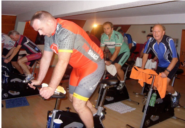
Die Eulen in Aktion: EULENPOWER!!

Seit November nun Indoor Cycling im VitaSport Center. Schön, dass sich diese Möglichkeit bot und das Feedback und die Teilnahme so phänomenal ist. Eine solide Vorbereitung für einen guten Start in die Radsaison 2012.