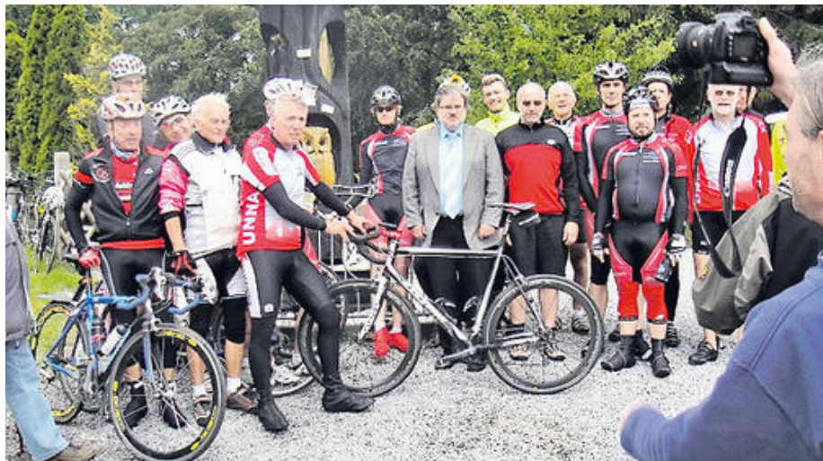
Gruppenbild an der Eule.

Das war einzigartig – danke dafür, denn viele Helfer haben es möglich gemacht und ich bin einfach nur Rad gefahren.